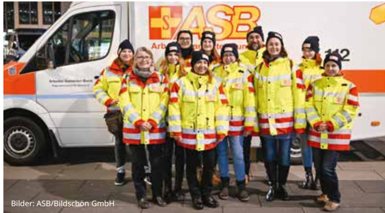
Das Kältehilfe-Team der Kölner Bundesgeschäftsstelle mit ASB-Präsidentin Katarina Barley (3. v. r.).