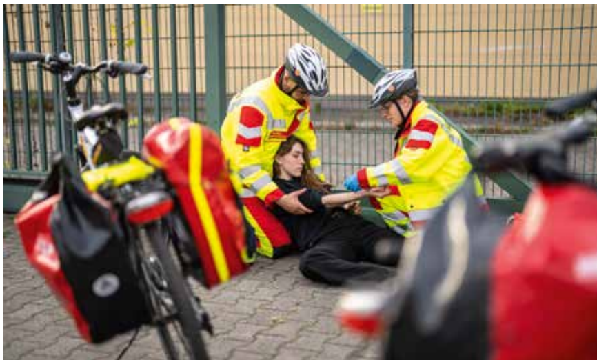
Im Notfall sind die Rettungskräfte des ASB auch per Fahrradstaffel zuverlässig und klimafreundlich unterwegs zur Einsatzstelle.

» zeigen, dass Nachhaltigkeit und Klimaneutralität Themen sind, die auch in den Wohlfahrtsverbänden eine Rolle spielen.