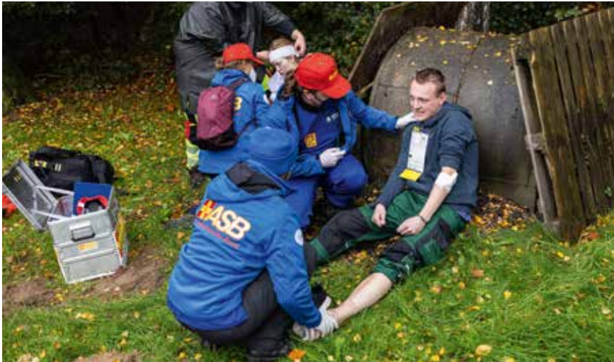
Nach einem Nachbeben: Mimen simulieren realistisch Verletzungen für die Einsatzkräfte.

der Einreise und Zollkontrolle, in denen unsere Freiwilligen übertragbare Erfahrungen für den realen Einsatz sammeln können.“