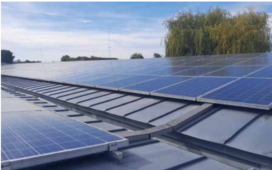
Stromkosten lassen sich langfristig beispielsweise durch eine Fotovoltaikanlage senken.

Ebenso wurden Strom- und Heizenergieverbrauch ermittelt. Der Stromverbrauch ergab sich pro Bewohner:in und CO 2 -Gehalt des Strommixes, die Heizenergie pro Heizplatz und Quadratmeter ➤➤