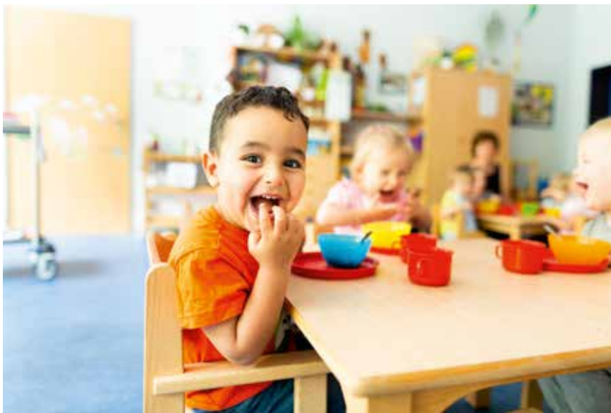
Eine nachhaltige Verpflegung ist auch in den ASB-Kitas ein wichtiges Thema.

➤ Gesamtfläche. So ist die Heizenergie aktuell für 15,77 Prozent und der Stromverbrauch für 16,64 Prozent der Emissionen verantwortlich. „Bei der Heizenergie lagen wir unter dem Durchschnitt. Beim Stromverbrauch über dem Durchschnitt“, fasst Sascha Schlegel zusammen. Für Wärme im Seniorenheim Sorge bereits eine moderne Pelletheizung. Stromkosten ließen sich langfristig beispielsweise durch eine Fotovoltaikanlage senken.