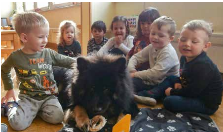
Im Kreise der Gratulant*innen: Kindergartenhund Gino feiert seinen ersten Geburtstag.